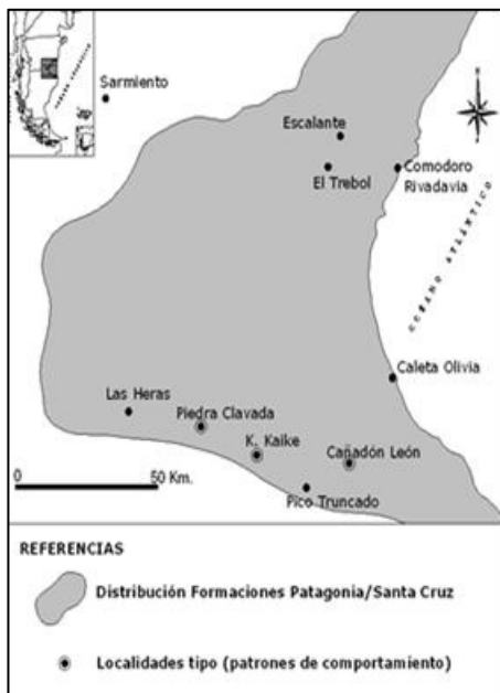
Figura 1. Ubicación de la zona (modificado de Paredes, 2002).

Comienza fundamentalmente en el sector oriental de la cuenca del Golfo San Jorge (Figura 1) y a propósito de la legislación aludida, a manifestarse la diferencia de criterios respecto a los conceptos de Formación Patagonia y acuífero "Patagoniano" que motiva esta contribución.