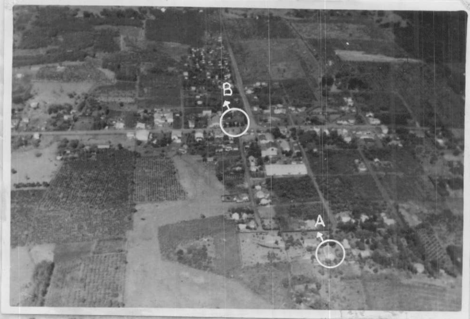
Fig. 1 - Eldorado. Vista aérea tomada desde el Norte. A) iglesia ortodoxa (corta mayor). B) edificio del Banco de la Nación Argentina.