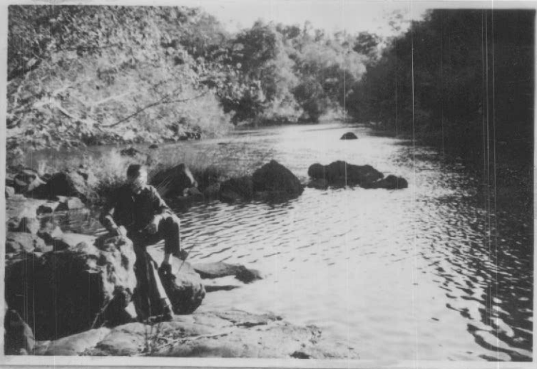
Fig. 2 - Arroyo Piray Mini (Eldorado). Lugar indicado para la captación de su caudal. Se distinguen las rocas basálticas que forman su lecho.