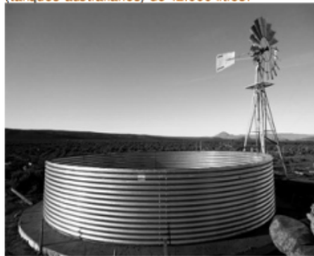
Figura 5. Equipamiento de una perforación, molino de viento y depósito de almacenamiento. Dpto. Cushamen. Provincia del Chubut.

El equipamiento de perforaciones agrupó dos conjuntos: las perforaciones existentes, un total de 17, y 10, correspondientes a las perforaciones efectuadas en la Etapa 2. Se instalaron 10 bombas solares de bajo caudal, 500 L/h, 17 molinos de viento de 8 pies, capacidad 1.450 L/h – 20 mbns – 20 Km/h. Se construyeron 27 depósitos de almacenamiento (tanques australianos) de 12.000 litros.