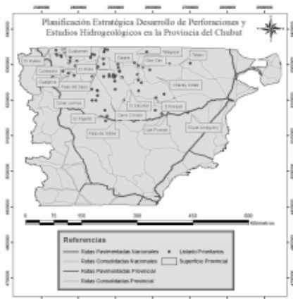
Figura 2. Localización de productores prioritarios y principales poblaciones de la Meseta Central. Provincia del Chubut.

urgente, la necesidad de efectuar una perforación, la cual cubriera las necesidades de agua. En la Figura 2, se observa la distribución de los productores identificados como "Prioritarios".