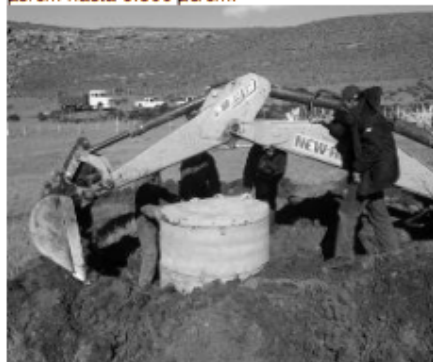
Figura 4. Construcción de un Pozo de Gran Diámetro. Colonia Aborígen Pichiñan. Dpto. Paso de Indios.

48 pozos de gran diámetro proyectados, se construyeron 30. Las profundidades promedian los 5 mbns (metros bajo nivel de suelo), mínimas de 2 mbns y máximas de 7,50 mbns. El nivel freático en general se estabiliza en los 2,5 mbns. Los valores de pH se comportaron de forma similar a los datos recabados en las perforaciones. Las conductividades medidas registraron valores muy disímiles, desde 120 \mu\text{s/cm} hasta 6.800 \mu\text{s/cm} .