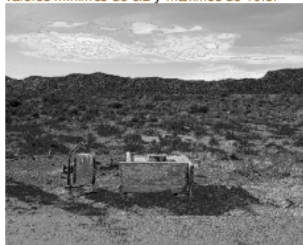
Figura 3. Perforación. Familia Pilquiman. Lagunita Salada. Dpto. de Gastre.

Respecto a las características físico-químicas medidas in situ, mediante sonda multiparamétrica, en general las aguas poseen bajas conductividades, valores menores a 800 \mu\text{s}/\text{cm} , en tres ocasiones se superaron los 3.000 \mu\text{s}/\text{cm} . El pH abarca un rango destacable, valores mínimos de 6.2 y máximos de 10.8.