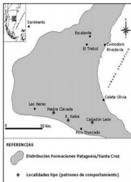
Figura 1. Ubicación de la zona (modificado de Paredes, 2002).

Comienza fundamentalmente en el sector oriental de la cuenca del Golfo San Jorge (Figura 1) y a propósito de la legislación aludida, a manifestarse la diferencia de criterios respecto a los conceptos de Formación Patagonia y acuífero "Patagoniano" que motiva esta contribución.