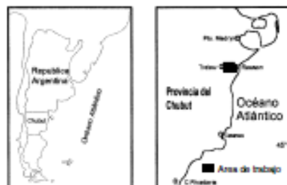
Figura 1. Mapa de ubicación del área de estudio.